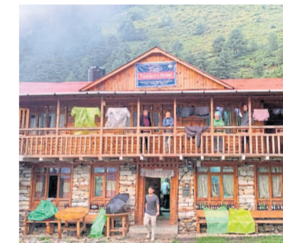
Das Gästehaus in guten Zeiten ...