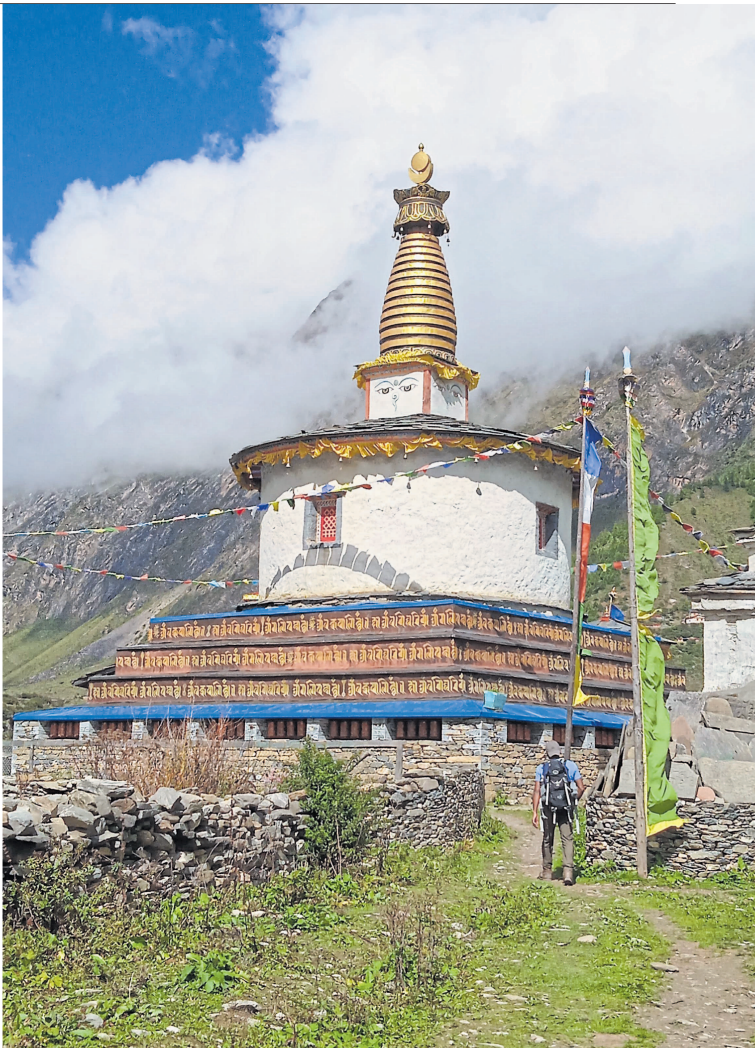
Tsum Stupa mit den alles sehenden Augen Buddhas.