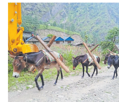
Ohne Mulis geht hier nichts.

Tsumba ein ganzer Kosmos von Gottheiten residiert. Das reiche Natur- und Kulturerbe des Tsum wird auch durch die einzigartigen Regeln des Shyagya-Gelübdes geschützt, in dem sich die Menschen dazu verpflichten, weder Haus- noch Wildtiere zu töten oder zum Schlachten zu verkaufen. Sogar das Sammeln von Wildbienenhonig ist demnach verboten, um die bedrohten Völker nicht zu gefährden.