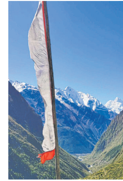
Die Gipfel sind meist namenlos.

Sobald ab März der Schnee schmilzt, dürfen auch die massigen Yaks wieder auf ihre Hochweiden mit Blick auf den knapp 8000 Meter hohen Himalchuli und hundert andere, meist namenlose Gipfel, in denen nach Überzeugung der